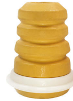
JUMPER III-DUCATO III-BOXER III

OE NO: 5033.E6 - 5033.A7 5033.A9-50705220