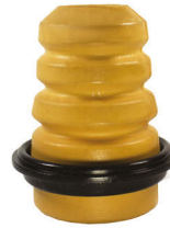
JUMPER III-BOXER II-DUCATO III